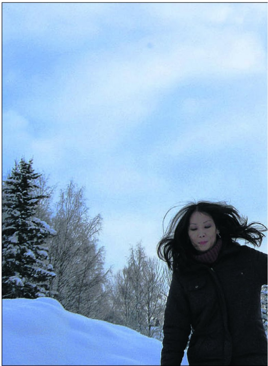
FRA KYOTO: Da Sienná bodde i Kyoto i Japan ble hun glad da hun så snø for det skjedde