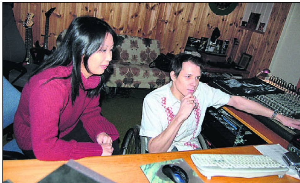
I STUDIO: Sienná og Abòn har innredet studio i den tidligere frikirka i Kolbu, i andre enden av huset har de leiligheten de bor i.

var også innom en liten klubb i Soho med sitt materiale.