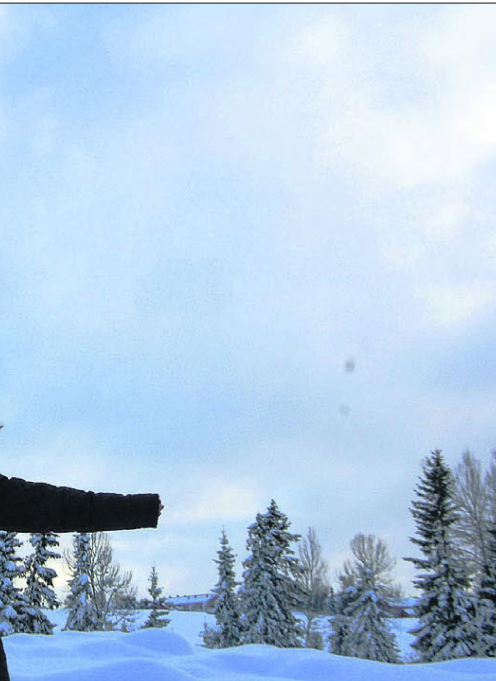
sjeldent, men etter at hun flyttet til Norge blir hun ikke like begeistret når vinteren kommer.